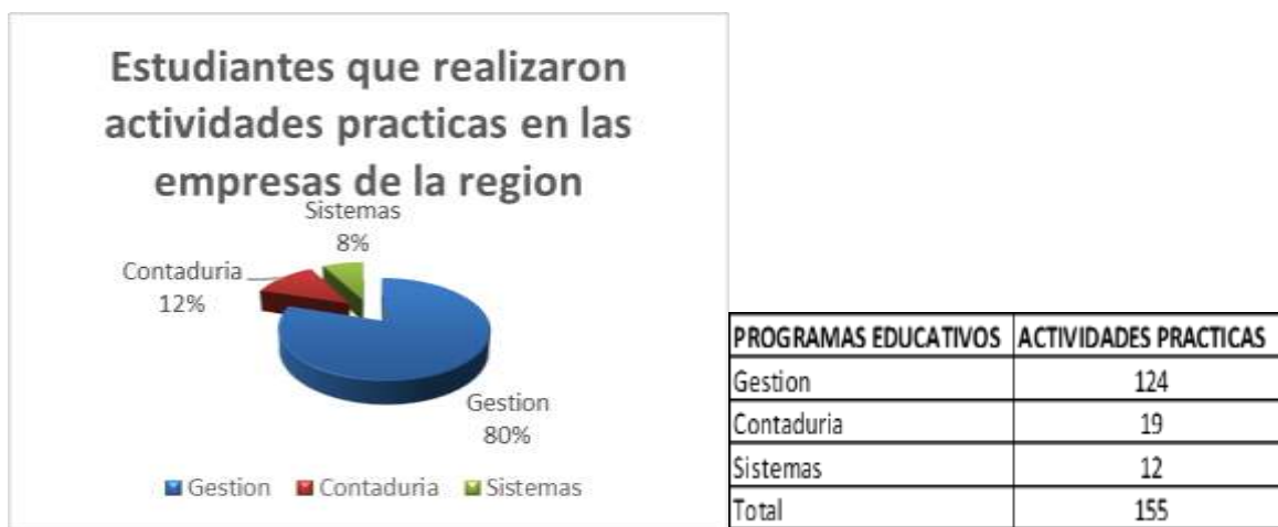
Grafica 2. Estudiantes por Programa Educativo

empresas de la región y que surgen a partir de sus clases en las experiencias educativas que cursan en la Facultad de Contaduría, ha generado la participación de estudiantes de los tres programas educativos: Contaduría, Gestión y Dirección de Negocios y Sistemas Computacionales Administrativos.