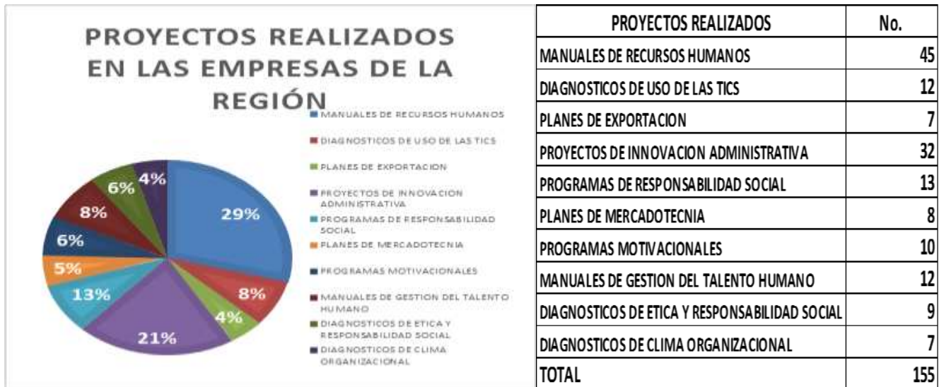
Grafica 3. Tipos de proyectos realizados en las empresas de la Región

Negocios, representando el 80%, un 12% de la Licenciatura en Contaduría y solo un 8% estudiantes de la Licenciatura en Sistemas Computacionales Administrativos