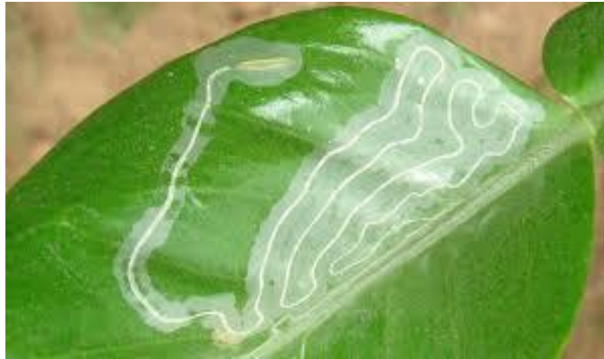
Figura 10. Daño causado por Phyllocnistis citrella .

Minador de la hoja. Las larvas de Phyllocnistis citrella , penetran las epidermis y comienzan a minar formando una galería en forma de zig-zag, lo cual ocasiona enrollamiento de la hoja, y posteriormente defoliación del árbol. Las hojas fuertemente atacadas, se secan, en los frutos afecta la calidad y en las hojas reduce su tamaño y deforma, afectando el rendimiento.