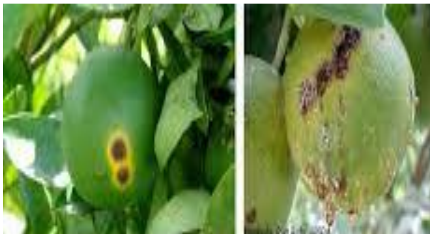
Figura 3. Daño causado por Xanthomonas campestris .

Cáncer de los cítricos. Causado por la bacteria Xanthomonas campestris . Las lesiones comienzan como manchitas, el tamaño de las lesiones depende del huésped y de la edad del tejido infectado. Las lesiones originalmente son circulares, pero con el tiempo se tornan irregulares. El minador asiático de la hoja ( Phyllocnistis citrella ), incrementa notablemente el número de lesiones individuales que rápidamente coalescen y forman lesiones largas a lo largo de las galerías del insecto. El síntoma característico de la enfermedad en las hojas, es el halo amarillo que rodea a las lesiones, sin embargo, este halo tiende a desaparecer conforme envejece la lesión. Otro síntoma útil del cancro es el margen acuoso de las lesiones que es fácilmente visto con luz transmitida (SENASICA, 2016).