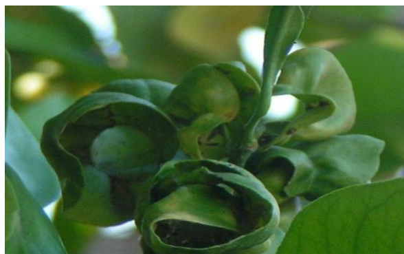
Figura 14. Daño causado por Spiroplasma citri .

Stubborn de los cítricos. Enfermedad muy importante en árboles jóvenes en ciertas áreas calientes y desérticas. Spiroplasma citri es el agente causal de la enfermedad. La enfermedad no es letal, pero cuando infecta a árboles jóvenes les produce un achaparramiento muy severo. Las hojas aparecen moteadas con clorosis en las venas, sin embargo estos síntomas pueden ser confundidos con ahorcamiento del tallo o deficiencias nutricionales. Los frutos son pocos pequeños, y normalmente no colorean en el lado del pedúnculo al madurar, tienen forma de bellota y semillas abortadas al igual que en huanglongbing (Mora-Aguilera et al. , 2013).