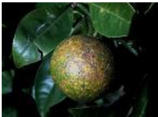
Figura 7. Daño causado por Aonidiella aurantii .

Escama roja de california. Aonidiella aurantii es un insecto que ocasiona daños en todas las partes del árbol incluyendo yemas, hojas, ramas, frutos y tronco son atacados succionando el tejido de las plantas. Los frutos infestados son los de baja calidad comercial y severas infestaciones pueden causar la muerte de pequeñas ramas y hojas, lo que ocasiona disminución en la producción y calidad de frutos e incluso pueden matar a los árboles (INIFAP, 2008).