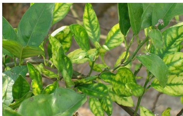
Figura 6. Daño causado por Xylella fastidiosa .

Escama roja de california. Aonidiella aurantii es un insecto que ocasiona daños en todas las partes del árbol incluyendo yemas, hojas, ramas, frutos y tronco son atacados succionando el tejido de las plantas. Los frutos infestados son los de baja calidad comercial y severas infestaciones pueden causar la muerte de pequeñas ramas y hojas, lo que ocasiona disminución en la producción y calidad de frutos e incluso pueden matar a los árboles (INIFAP, 2008).