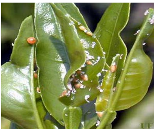
Figura 9. Daño causado por Diaphorina citri .

Huanglongbing (HLB). También conocida como enverdecimiento de los cítricos (Greening), enfermedad bacteriana de las plantas que, aunque no es peligrosa para los humanos, destruye la producción, apariencia y valor económico de los árboles de cítricos, y el sabor de la fruta y su jugo. El vector es Diaphorina citri . Una vez que un árbol está infectado, no tiene cura. Los árboles enfermos producen frutos amargos, incomibles, deformes y, con el tiempo, mueren. Se reportó por primera vez en México en julio de 2009 en la localidad de El Cuyo en el municipio de Tizimín, Yucatán. El limón mexicano, naranjo trifoliado y los trifoliados híbridos son más tolerantes al huanglongbing. (SENASICA, 2009 y 2010; Mora-Aguilera et al. , 2013).