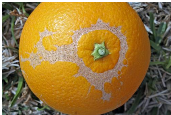
Figura 15. Daño causado por Scirtothrips citri .

Trips de los cítricos. La especie de trips reportada atacando cítricos es Scirtothrips citri (Moulton), el cual es un insecto pequeño, amarillo-naranja, con alas con flecos, las larvas son iguales al adulto, con la diferencia de no presencia de alas. El trips de los cítricos, únicamente afecta la calidad de la fruta, y no afecta la producción (Rocha-Peña et al. , 2009).