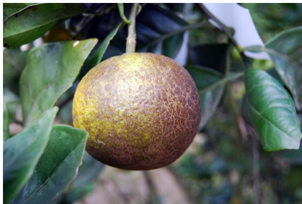
Figura 1. Daño causado por Eutetranychus banksi .

Ácaros en los cítricos. La especie fue identificada como Eutetranychus banksi (McGregor), conocida comúnmente como ácaro de Texas. Las poblaciones son más comunes en otoño e invierno; estos ácaros tienen preferencia por invadir el haz de las hojas, alcanzando en ocasiones más de 100 individuos por hoja (Guanillo y Martínez, 2009).