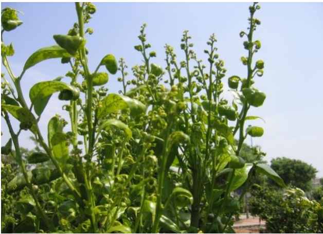
Figura 16. Daño por Toxoptera citricida .

Virus de la tristeza de los cítricos (VTC). Es sin duda la enfermedad más devastadora de los cítricos injertados en naranjo agrio a nivel mundial, en México por primera vez en el año 2000 en la parte norte de los estados de Quintana Roo y Yucatán. Actualmente su distribución comprende también a los estados de Campeche, Tabasco, Veracruz, Tamaulipas, San Luis Potosí, Hidalgo, Chiapas, Oaxaca y Guerrero (SENASICA, 2013). El pulgón café de los cítricos ( Toxoptera citricida ), es el principal transmisor de esta enfermedad. Este virus provoca que los árboles no se desarrollen adecuadamente y hace que mueran cuando están injertados en naranja agrio (cucho) (Iracheta et al. , 2012).