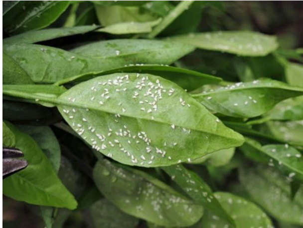
Figura 12. Daño causado por Aleurothrixus floccosus .

Mosquita blanca de los cítricos. Aleurothrixus floccosus es una plaga que afecta drásticamente el rendimiento y calidad de los cítricos durante 2 años consecutivos (López y Segade, 2017).