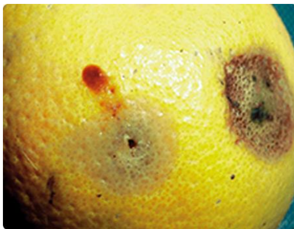
Figura 11. Daño causado por Anastrepha ludens .

Mosca de la fruta. O mosca mediterránea de la fruta Anastrepha ludens , ya que en los países mediterráneos es donde su incidencia económica se ha hecho más patente, afectando a numerosos cultivos, sobre todo cítricos y frutales de semilla grande y de pepita. Los producidos por la picadura de la hembra en la oviposición produce un pequeño orificio en la superficie del fruto que forma a su alrededor una mancha amarilla si es sobre naranjas (Conde-Blanco, 2018).