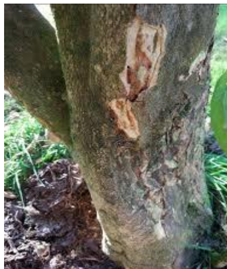
Figura 13. Daño causado por Psorosis.

Psorosis. Enfermedad de avance lento, a veces tarda 10 a 20 años en expresar los síntomas. Todas las especies de cítricos son susceptibles y está presente en todas las áreas citrícolas de México. El síntoma más típico de la enfermedad es el descortezamiento del árbol en forma de escamas, localizadas o generalizado en el tronco o sus ramas. Los árboles se tornan improductivos al poco tiempo de presentarse la enfermedad (Maruchi, 2000).