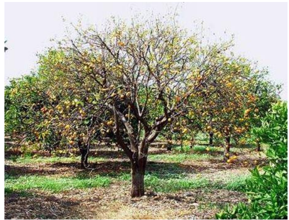
Figura17. Daño causado por VTC.

En la actualidad existe una enfermedad que se puede confundir muy fácilmente con el VTC, CVC o HLB, sin embargo hay características propias que han dejado entre ver que se trata de una nueva enfermedad agresiva y desconocida por lo que se le denomina por los productores de la región como “amarillamiento de los cítricos”. Dicha enfermedad ataca a las plantas de naranja en especial y las características que se han reportado son: amarillamiento de secciones de ramas o ramas enteras, después de esto, las puntas de las ramas comienzan a secarse y va avanzando hasta llegar al tronco de las plantas para finalmente secarlas por completo.