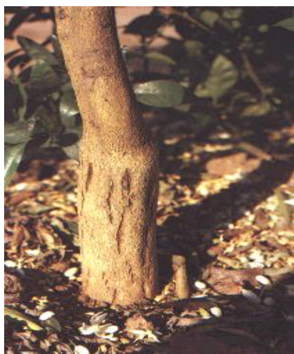
Figura 8. Daño causado por Exocostis .

Huanglongbing (HLB). También conocida como enverdecimiento de los cítricos (Greening), enfermedad bacteriana de las plantas que, aunque no es peligrosa para los humanos, destruye la producción, apariencia y valor económico de los árboles de cítricos, y el sabor de la fruta y su jugo. El vector es Diaphorina citri . Una vez que un árbol está infectado, no tiene cura. Los árboles enfermos producen frutos amargos, incomibles, deformes y, con el tiempo, mueren. Se reportó por primera vez en México en julio de 2009 en la localidad de El Cuyo en el municipio de Tizimín, Yucatán. El limón mexicano, naranjo trifoliado y los trifoliados híbridos son más tolerantes al huanglongbing. (SENASICA, 2009 y 2010; Mora-Aguilera et al. , 2013).