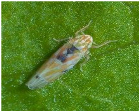
Figura 4. Ejemplar adulto de Erythroneura .

Chicharrita. Erythroneura spp y Empoasca fabae , no es una plaga primaria de cítricos, sin embargo, en inviernos lluviosos puede ser una plaga potencial de los cítricos, dañando más del 20% la producción. El insecto se alimenta del flavedo de la cáscara de la fruta.