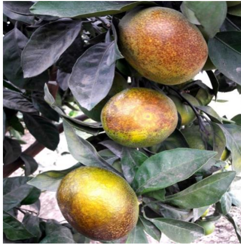
Figura 2. Daño causado por Phyllocoptruta oleivora .

Cáncer de los cítricos. Causado por la bacteria Xanthomonas campestris . Las lesiones comienzan como manchitas, el tamaño de las lesiones depende del huésped y de la edad del tejido infectado. Las lesiones originalmente son circulares, pero con el tiempo se tornan irregulares. El minador asiático de la hoja ( Phyllocnistis citrella ), incrementa notablemente el número de lesiones individuales que rápidamente coalescen y forman lesiones largas a lo largo de las galerías del insecto. El síntoma característico de la enfermedad en las hojas, es el halo amarillo que rodea a las lesiones, sin embargo, este halo tiende a desaparecer conforme envejece la lesión. Otro síntoma útil del cancro es el margen acuoso de las lesiones que es fácilmente visto con luz transmitida (SENASICA, 2016).