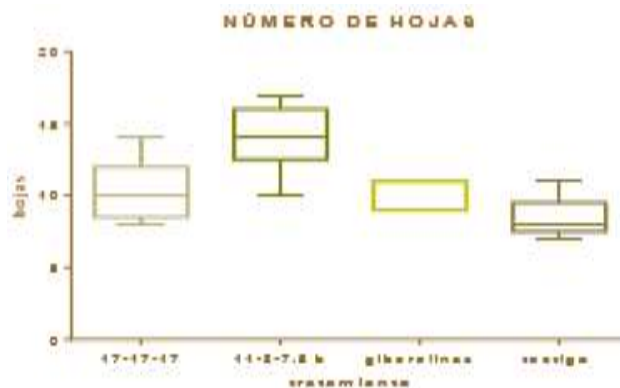
Figura 2. Resultados de número de hojas de la planta con respecto a los tratamientos utilizados.

De acuerdo a un estudio realizado en Brasil por el ingeniero Sergio. Demostró que los rendimientos están directamente relacionados con los niveles de nitrógeno aplicado, es decir a mayor nivel de nitrógeno mayor rendimiento obtenido; Con la correcta aplicación de N llegó a superar las tres toneladas por hectárea en algunos casos (Solutions for human progress [SQM], 2018). Es un fertilizante a base de mezcla física granulada que ofrece los nutrientes más importantes para cualquier tipo de planta, de acuerdo al porcentaje de nitrógeno con el que cuenta el fertilizante Happy Flower nos ayudó a obtener gran significancia en nuestro número de hojas por planta.