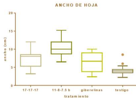
Figura 3. Resultados de ancho de hojas de la planta con respecto a los tratamientos utilizados.

El fertilizante es universal para todo tipo de planta, está elaborado con los tres nutrientes esenciales nitrógeno, fósforo y potasio, en esta variable de ancho de hojas fue el que nos dio un mayor rendimiento.