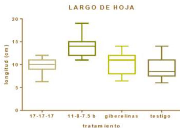
Figura 4. Resultados del largo de hojas de la planta con respecto a los tratamientos utilizados.