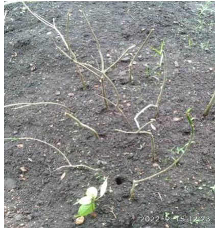
Figura 1. Modulo forestal en la facultad de Ingeniería en Sistemas de Producción Agropecuaria de Acayucan, Veracruz (izquierda). Varetas de S. aromaticum . Se observa el tejido vivo de color verde de las varetas con potencial de propagación (derecha).