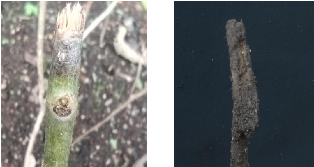
Figura 3. La vareta presentó afectaciones en la parte apical producidas por un hongo que la pudrió. La afectación fue en sentido descendente hasta que afectó al rebrote (izquierda). La parte basal de la vareta no produjo raíces aún con el enraizador pero tampoco mostró afectaciones por hongos o bacterias (derecha).

En la semana cuatro se registró la pudrición de la vareta que contenía el rebrote, lo cual ocasionó que la vareta se muriera junto con el rebrote. Aparentemente se trató de un hongo oportunista que afectó a la vareta por la gran cantidad de precipitación que se registró en la semana tres y cuatro de iniciado el experimento. La vareta fue desenterrada y no presentó crecimiento radicular ni mostró afectaciones por hongos (Figura 3).