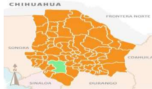
Figura 1: Localización del municipio de Guachochi, Chihuahua.

El proyecto se elaboró en el municipio de Guachochi, Chihuahua: