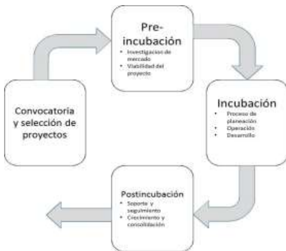
Figura 3: Modelo de incubación, para Incubadoras de Tecnología Intermedia Fuente: Secretaría de Economía, 2016.

Desarrollo del Modelo de Incubación de negocios Convocatoria y selección (23 días) Abarca desde el diseño y lanzamiento de la convocatoria hasta la selección de proyectos bajo las siguientes políticas: